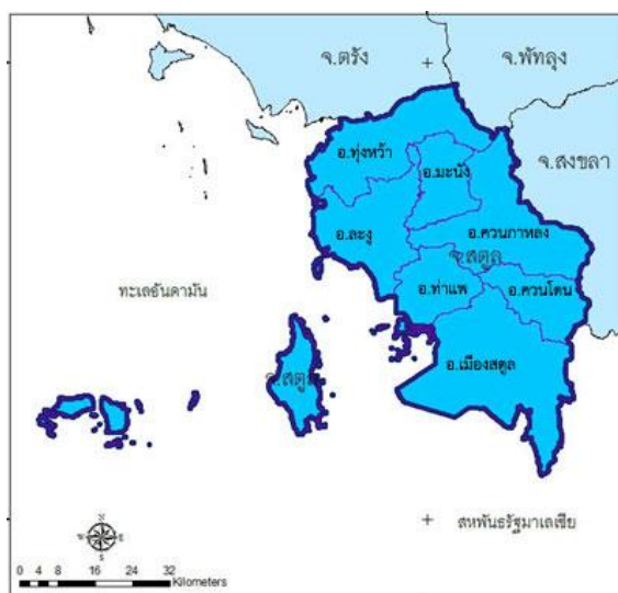
ภาพที่ 1.1 แสดงที่ตั้งและอาณาเขตของจังหวัดสตูล